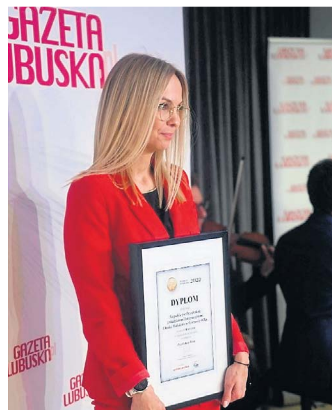
Niepubliczne przedszkole z oddziałami integracyjnymi Chatka Małolatka w Gorzowie Wielkopolskim

cia kulinarne „Kuchcikowo”, warsztaty taneczne, matematyczne, zajęcia szachowe.