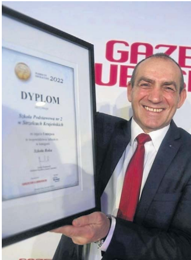
Są powody do dumy - dyplom dla najlepszej szkoły!

Szkoła ma bogate tradycje. Wiele uroczystości wpisało się na stałe w życie społeczności uczniowskiej i środowiska lokalnego. Pedagodzy zachęcają uczniów do poszukiwania dzie-