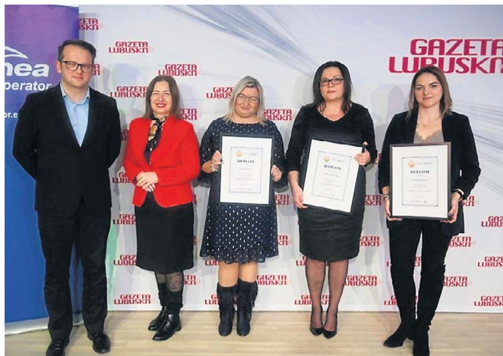
Laureatki kategorii Dyrektor Roku Placówki Edukacyjnej w województwie lubuskim

jest to dla Niej wielkie wyróżnienie, do którego przyczynili się rodzice uczniów szkoły, w której pracuje. Że to miłe zaskoczenie, lepsze od niejednej nagrody.