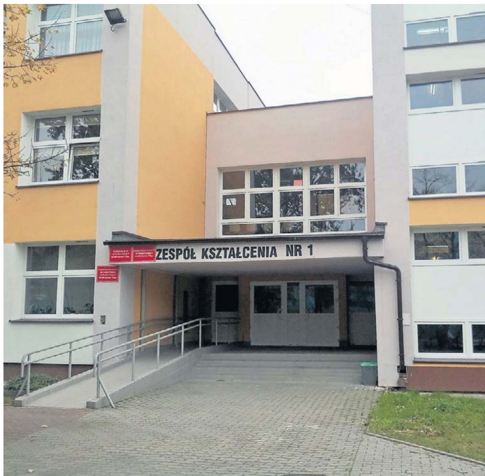
Zespół Kształcenia Specjalnego nr 1 im. Karola Wojtyły w Gorzowie Wielkopolskim