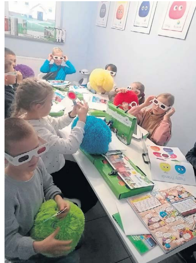
Gorzów Wielkopolski, Sikorskiego 100

atywnych narzędzi edukacyjnych, a efekty widoczne są i udokumentowane przez certyfikaty.