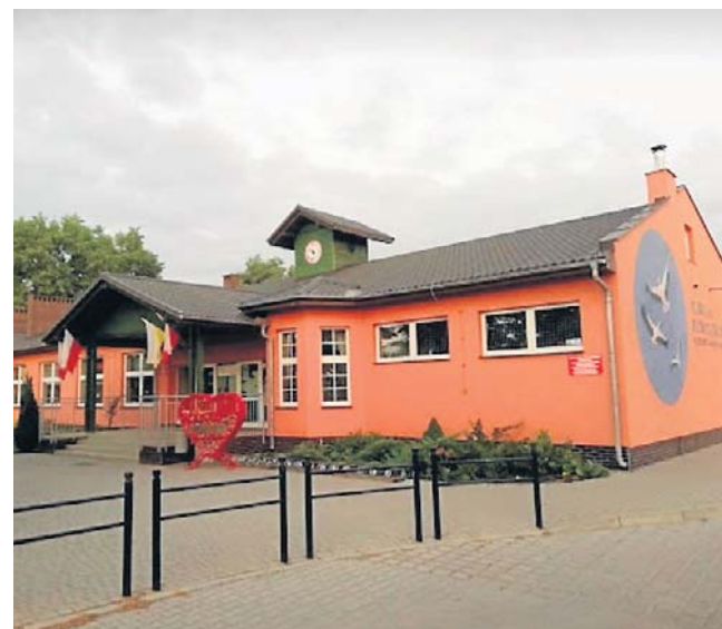
SP im. Jana Pawła II, Ciecierzyc, Borkowska 2

Kadra stara się być wsparciem w radzeniu sobie z trudnymi emocjami i wyzwaniami, jakich doświadczają uczniowie na co dzień. Stara się angażować uczniów do aktywności obywatelskiej oraz społecznej.