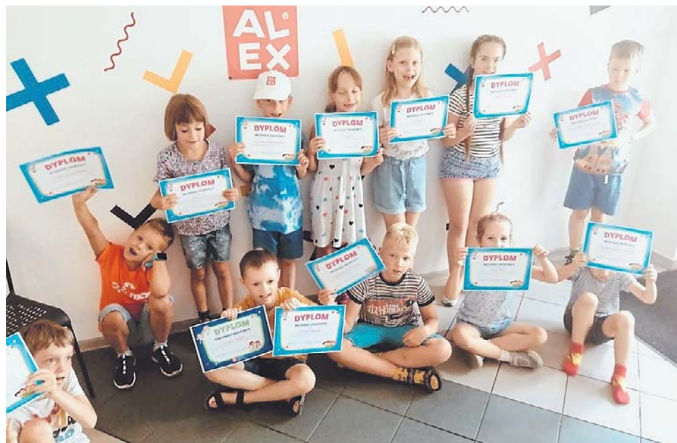
Nunc interdum tempor dolor interdum laoret. Nam id

KATEGORIA: SZKOŁA JĘZYKOWA ROKU - III miejsce