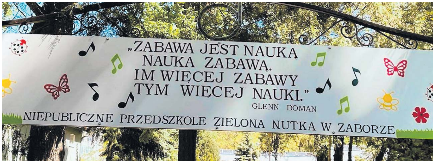
Niepubliczne Przedszkole w Zaborze Zielona Nutka, Zabór ul. Akacyjowa 1

Niepubliczne Przedszkole Zielona Nutka oferuje edukację dzieci jako ciągły, wielopłaszczyznowy proces pomagający podopiecznym zrozumieć otaczający ich świat oraz uczy reagować na nowe współczesne wyzwania. - Nasza placówka jest miejscem, w którym wychowanek jest kreowany na człowieka cechującego się wyrozumiałością dla innych, szanującego